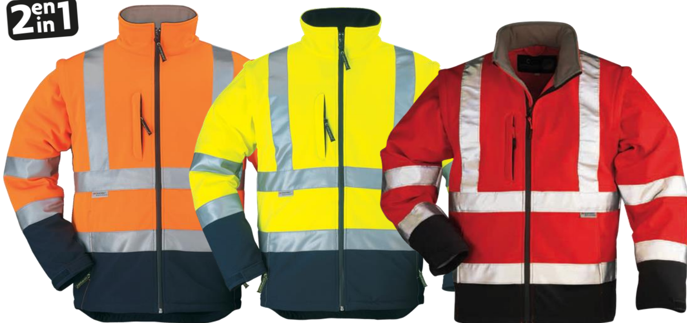
Orange / Bleu