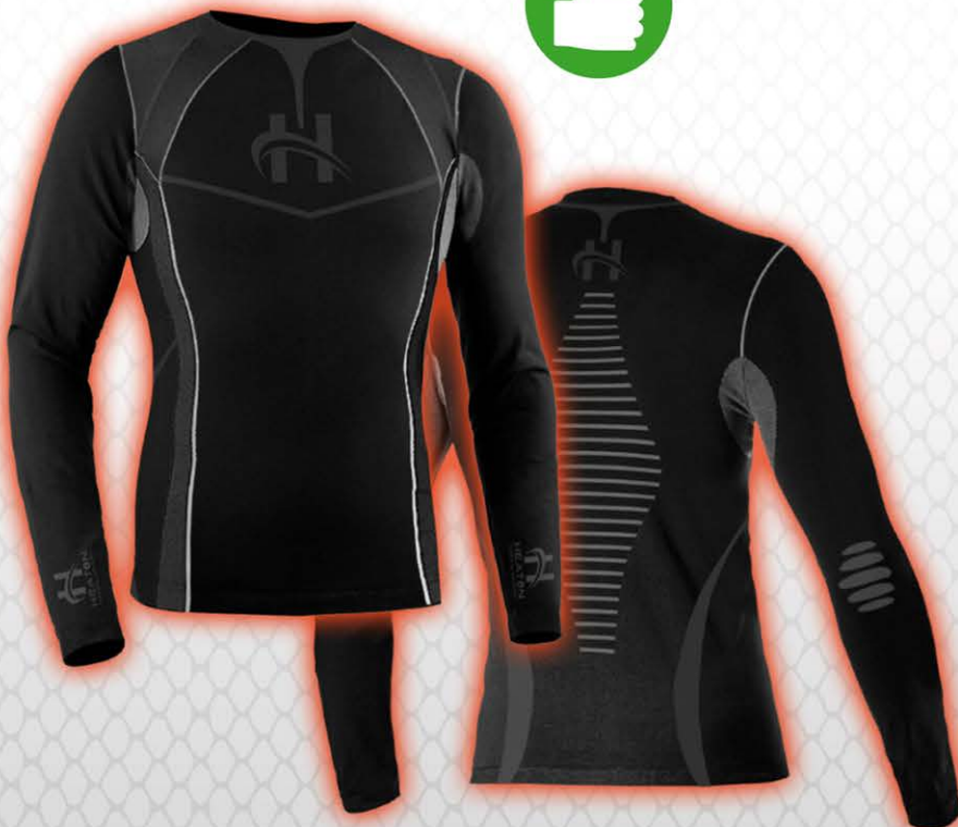
Maglia riscaldata HEATON HEATON heated shirt