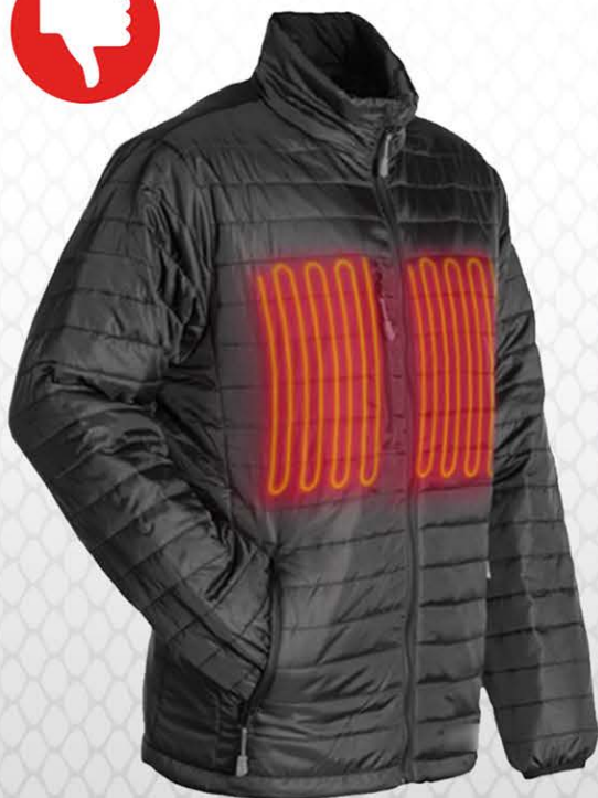
Una comune giacca riscaldante A common heating jacket