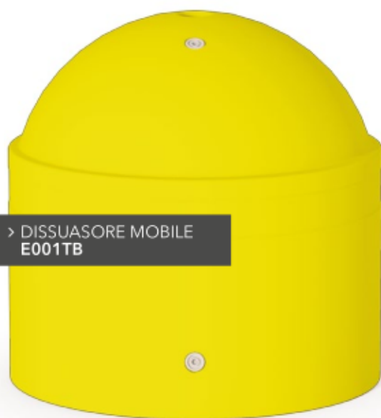
> DISSUASORE MOBILE E001TB