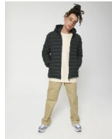
Stanley Voyager Wool-Like

Shell : Plain Weave Brushed , 100% poliestere riciclato , Fluorine-free DWR , 140 GSM